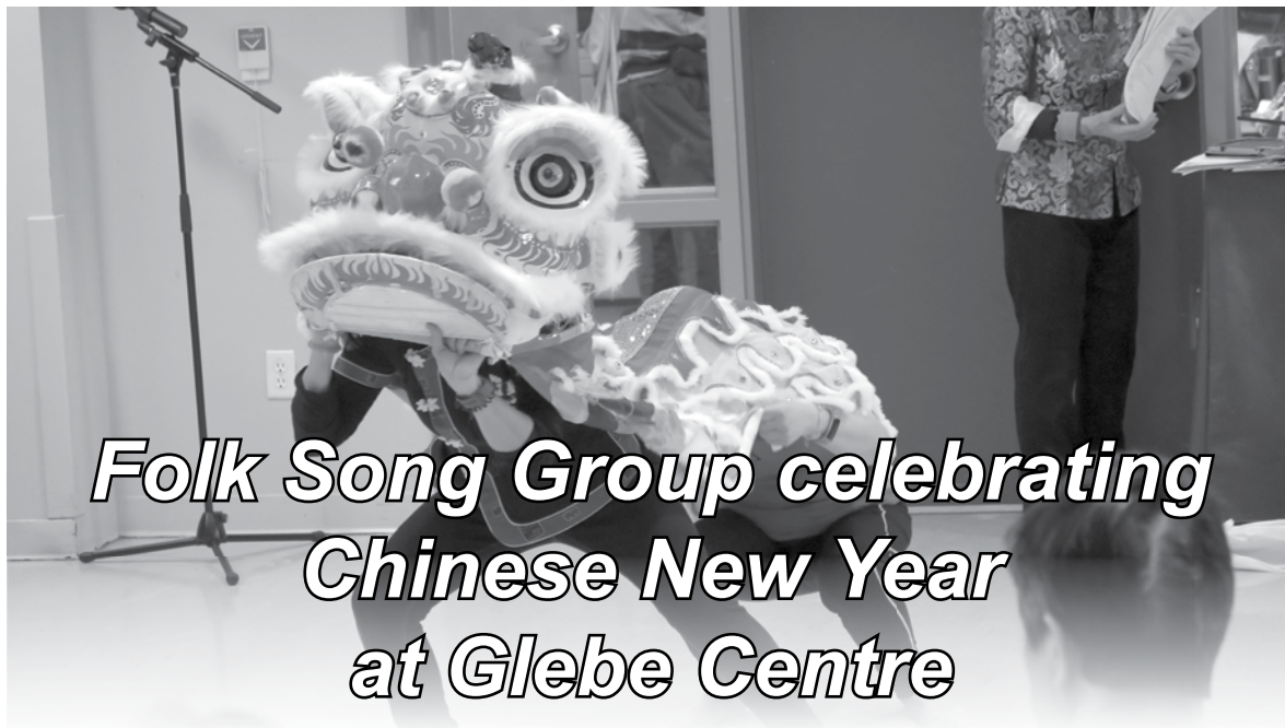
Folk Song Group celebrating Chinese New Year at Glebe Centre